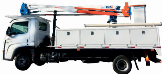
TABELA DE TRABALHO