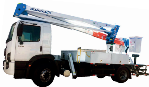
TABELA DE TRABALHO