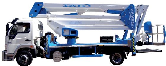
TABELA DE TRABALHO